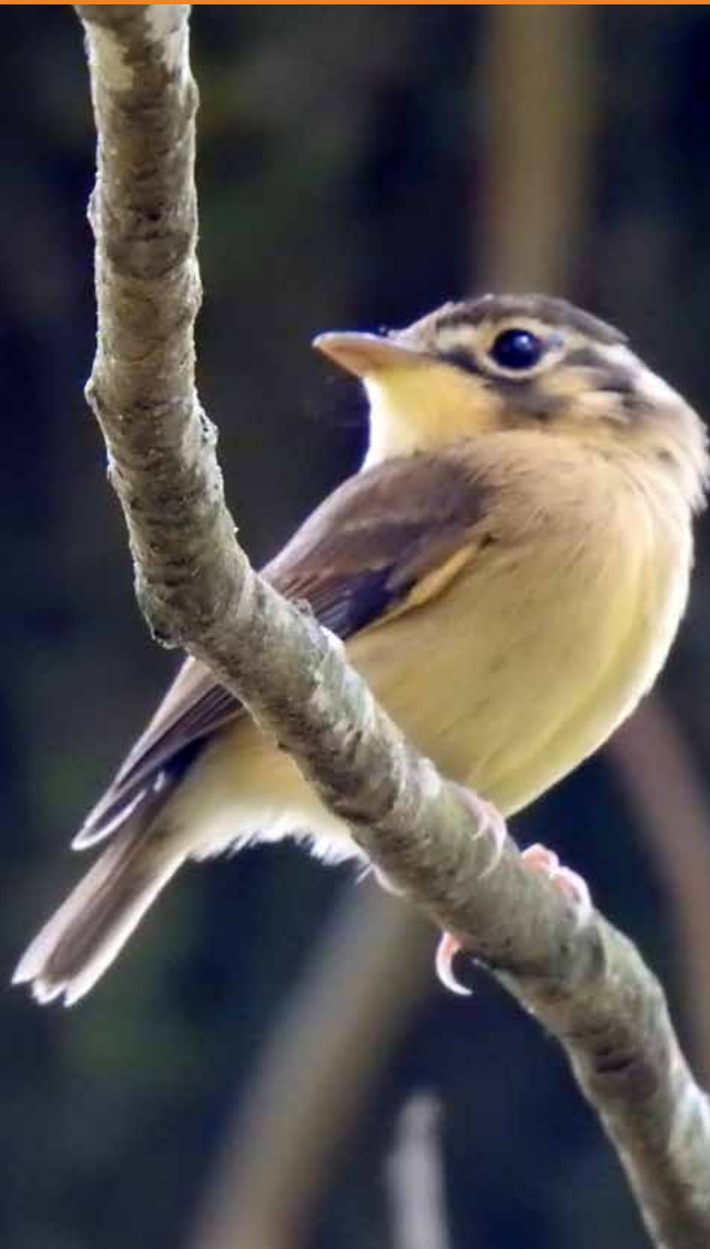
“Patinho” ( Platyrinchus mystaceus ), avistado na “matinha” da Aitiara.